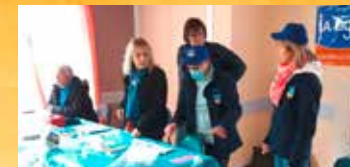
Stand inscription Marche bleue Deyvillers 2022

Organisation de manifestations, diffusion de documentation : 56 651 €