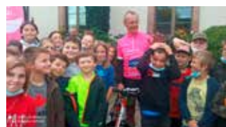
Le Tour des Vosges Solidaire, passage à Gérardmer

Soins de support gratuits pour les patients 28 401 €