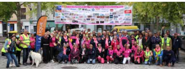
Bénévoles et partenaires des Foulées Roses Spinaliennes 2021

5 ème Edition des Foulées des Barbus à Epinal le 6 novembre (Parc du Château, départ 10h30).