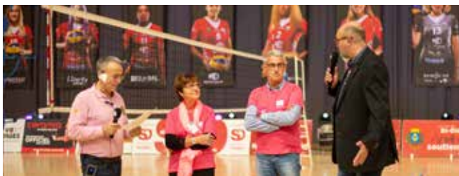
Les Louves de Saint-Dié - 2021 - Crédit photo : Antoine Gabillaud.