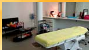
Cabine de socio esthétique Centre Hospitalier Epinal