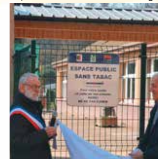
Inauguration Espace sans tabac à Pouxoux

Implantations d'Espaces sans Tabac (aires de jeux, entrées des écoles) en partenariat avec les Municipalités. A ce jour, 55 espaces créés dans les Vosges.