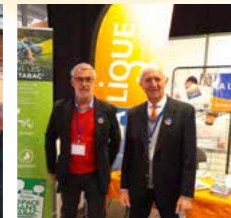
Stand d'information - Salon des Maires 2021