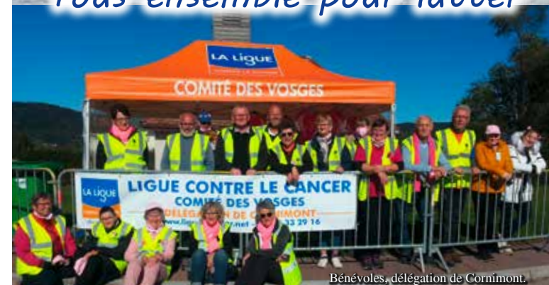
Bénévoles, délégation de Cornimont.

Grâce à votre générosité nous remportons des victoires sur le Cancer ... Tout ce qu'il est possible de faire, la Ligue le fait