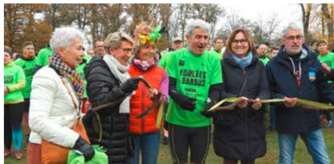
Coupure du ruban - Foulées des Barbus novembre 2021